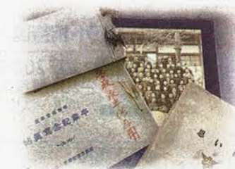
閉校した京都市内の小学校の卒業アルバムの変遷。明治時代中頃は1枚の写真だったが、行事写真や卒業文集が含まれた冊子に「進化」していった(京都市学校歴史博物館所蔵)