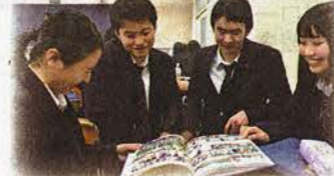
卒業式を翌日に控え、卒業アルバムを眺める高校生(3月13日、東京都調布市の都立調布北高校で)